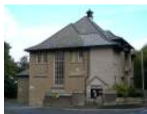
Canolfan Gymunedol Penmaenmawr

Ydych chi eisiau cymorth y Cyngor? Oes gennych chi sylwadau neu awgrymiadau ar gyfer canolfan gymunedol sy'n addas ar gyfer yr 21 ain ganrif? Beth ddylid defnyddio'r ganolfan ar ei gyfer?