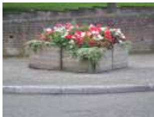
Gwneud Penmaenmawr, Penmaenan a Dwygyfylchi yn brydferth

Mae Penmaenmawr yn hynod o ffodus o gael unigolion a grwpiau gweithgar sy'n gweithio i wella'r amgylchedd a safon y profiad ar gyfer pobl sy'n byw, gweithio ac yn ymweld â'r ardal. Mae'r Cyngor yn rhannu'r weledi-gaeth yma. Ei nod yw gwrandio a gweithio mewn cydweithrediad â'r gymuned a gyda'r bobl yma er mwyn cynnal a hyrwyddo cymeriad Penmaenmawr —ei hamgylchedd, ei threftadaeth, ei hadnoddau a'i phobl. Ac yna gobeithio, fydd popeth yn dod ynghyd.